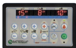
CONSOLE COMANDI CONTROL PANEL