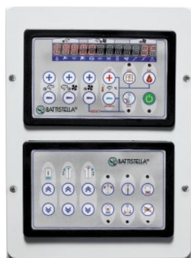
CONSOLE COMANDI CONTROL PANEL